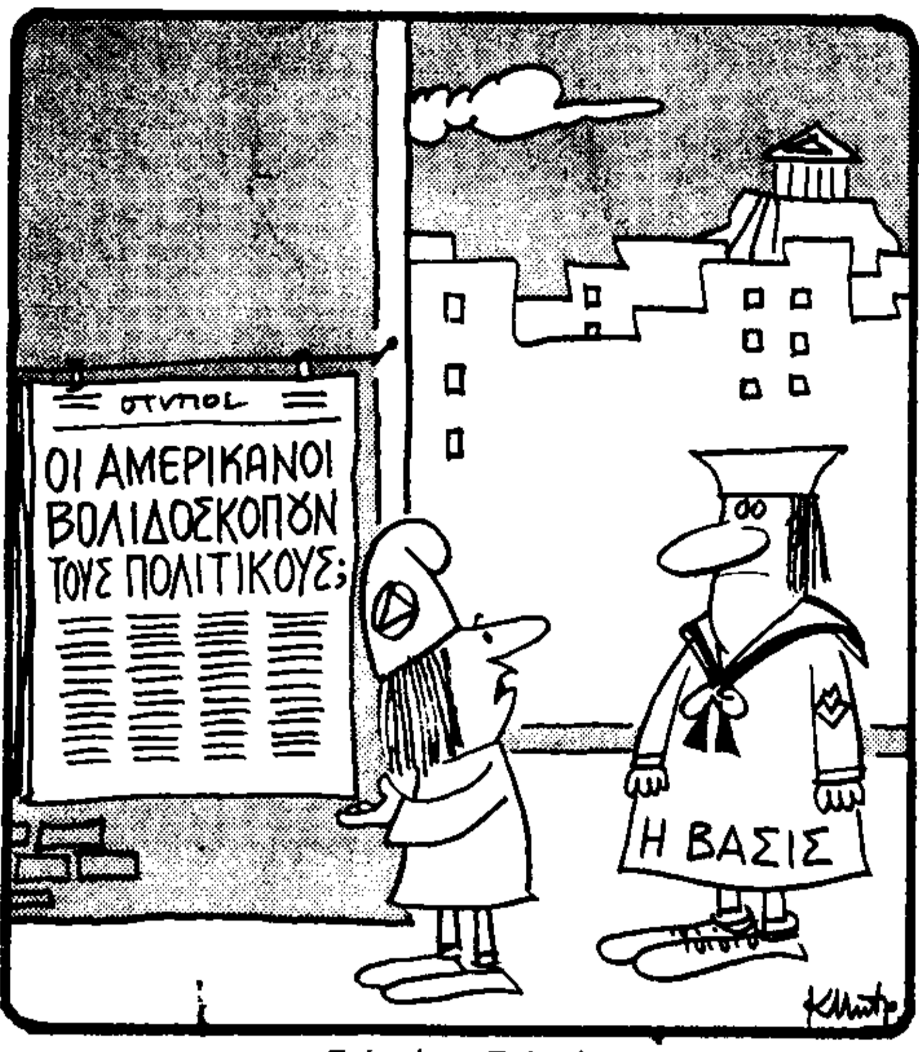
— Για μένα; Για σένα; (Του Κ. Μπαρούλιου)